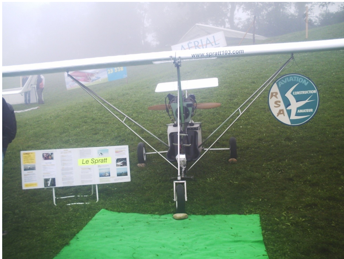
Spratt 103 à St Hilaire du Touvet pendant les heures d'ouvertures + Voir film fait par FR3 en page Médias du site